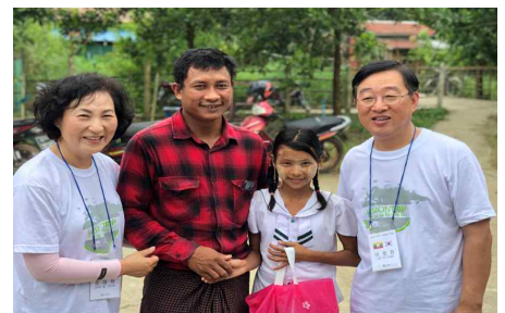
〈비전트립 및 결연아동과의 만남〉