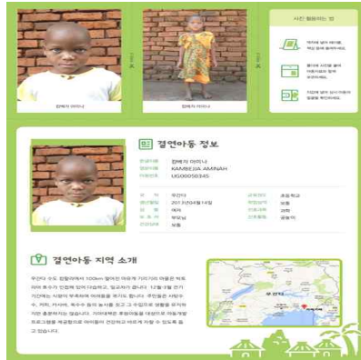
〈아동 소개자료 - 1주 후〉