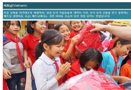
〈어린이날, 크리스마스 선물금〉