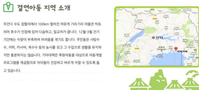
〈결연 후원안내 - 3~5일 후〉