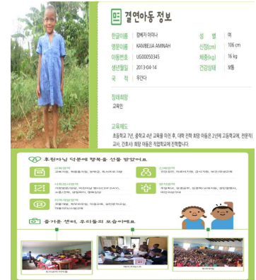
〈서신 및 보고서 (연1~2회)〉